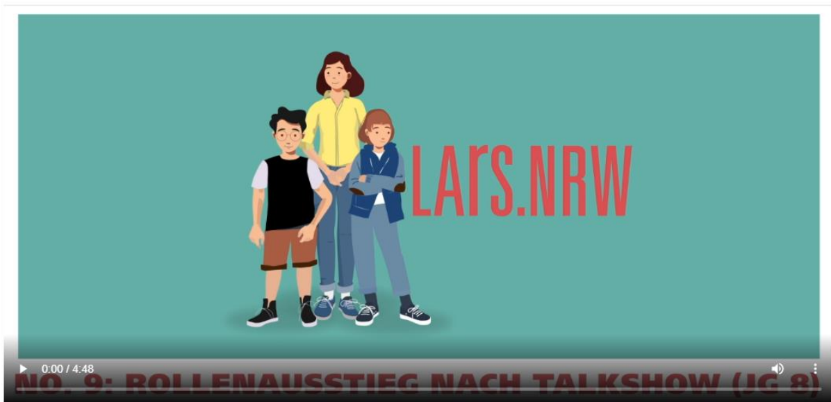
Abbildung 1: Screenshot des Videos „No. 9: Rollenausstieg nach Talkshow (JG 8)“

Wichtig: Speichern Sie Ihre Antworten auf die offenen Fragen in einem separaten Dokument, um Datenverlusten vorzubeugen.