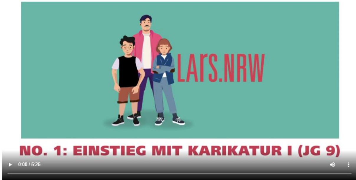
Abbildung 2: Screenshot des Videos „No. 1: Einstieg mit Karikatur I (JG 9)“