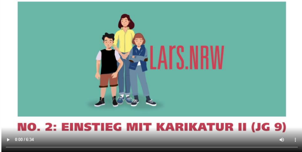
Abbildung 3: Screenshot des Videos „No. 2: Einstieg mit Karikatur II (JG 9)“